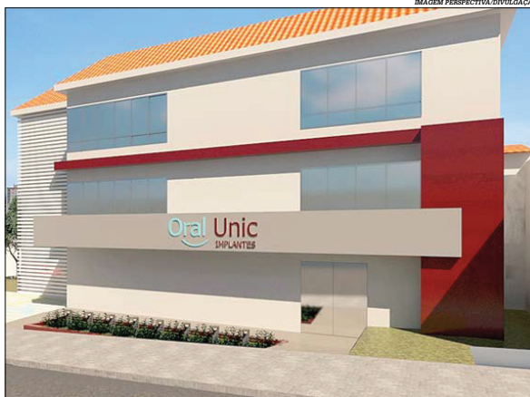
Foram investidos cerca de R$ 1 milhão na estrutura da unidade localizada em Betim

Oral Unic traz para Betim o conceito All-in-one , que possibilita ao paciente realizar todos os exames e acompanhamentos neces-